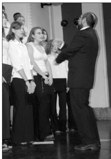
Benefiční koncert 2006 ve Žďáru nad Sázavou Sbor gymnázia V. Makovského z Nového Města na Moravě