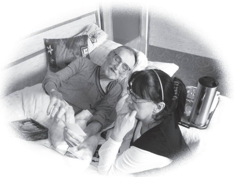
Domácí hospicová péče