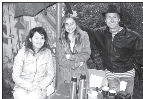
Dobrovonice HHV – Jihlava