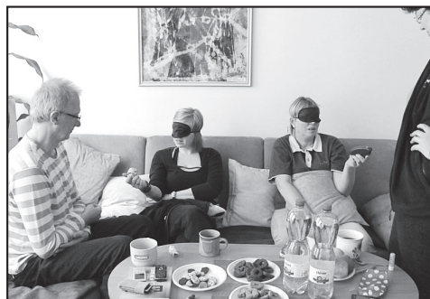
Školení bazální stimulace