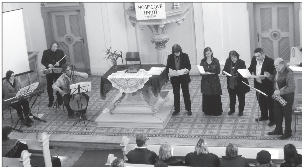
Benefiční koncert CK Vocal

(Kompletní zpráva nezávislého auditora o účetní závěrce i o výroční zprávě je k dispozici v sídle organizace.)