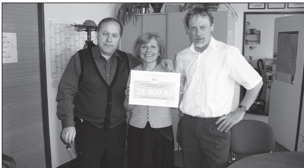
Předání finančního daru od nadace Umění doprovázet

patří všem našim klientům a rodinám, u nichž jsme mohli poskytovat domácí hospicovou péči a péči na rodinném pokoji, ale samozřejmě i klienti všech našich dalších služeb. Všichni tito nám dali svou důvěru a spolupracovali s námi většinou v nejtěžších chvílích svého života. Upřímně děkujeme.